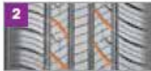
Canales curvos de ángulo rápido minimiza el ruido