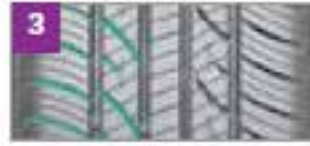
Canal lateral - Un viaje tranquilo y confortable con una excelente tracción y frenado