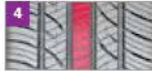
Banda de rodamiento central en línea recta ayuda a la estabilidad de conducción a altas velocidades